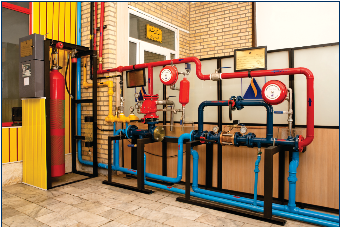
آزمون مهارکننده آتش با استفاده از کربن دی اکسید یا گاز بی اثر

آزمایشگاه شرکت مهندسی ایمن تیار علاوه بر سیستم های گازی مهارکننده آتش به منظور اطمینان از عملکرد صحیح سیستم های شیر سیلابی و شیر یکطرفه هشدار دهنده، مهار آتش را بوسیله سیستم های آبی نیز، مورد آزمون قرار می دهد.